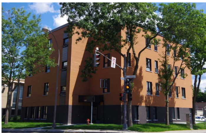
Le parcours

En 2021-2022, les employées du CMCQ ainsi qu'un expert de vécu ont assisté à certaines rencontres du comité de locataires. La pandémie a malheureusement forcé par moment l'arrêt de nos présences à ces rencontres. Lors de nos présences, nous avons joué un rôle conseil et d'accompagnement pour leurs démarches de financement.