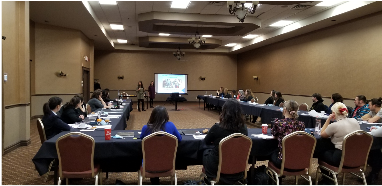
Formation du 23 mars

Nous avons d'ailleurs aidé à l'organisation d'une formation sur l'encombrement donnée par la Maison Grise de Montréal. La formation était offerte à des organisations du CIUSSS, d'organismes communautaires, du milieu municipal et du milieu de l'habitation. La coordonnatrice y a assisté, ce qui pourra servir dans de futurs accompagnements avec des chambreurs et chambreuses.