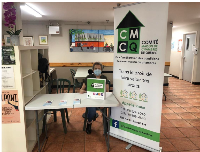
Kiosque au Café-rencontre du centre-ville