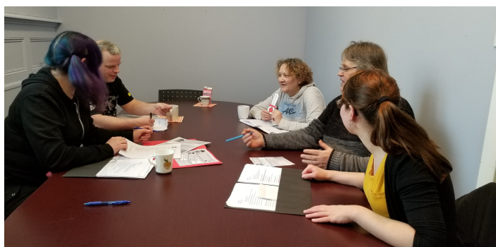
Les débuts de chambreur en ville

Moi mon implication, ça me permet de sortir, de ne pas rester chez moi, de redonner à la société pour l'argent que je reçois.